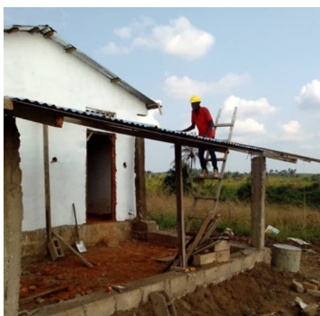
Costruzione della tettoia esterna di attesa