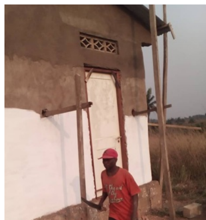
Decorì in facciata